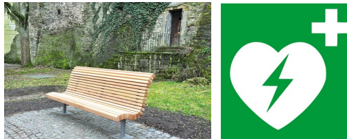
Spendenprojekte ‚Bürgerbänke und Defis für Backnang‘